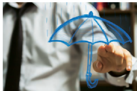
GUT ABGESCHIRMT: Erst wenn der Ernstfall eintritt, zeigt sich, wie gut die Versicherung ist

Zusätzlich wurden die Stärken und Schwächen der Anbieter in verschiedenen Disziplinen herausgearbeitet. Hierzu wurden die Items fünf Fairness-Kategorien zugeordnet. Die Kategoriennoten ergaben sich aus dem Durchschnitt der jeweiligen Indexwerte, das Urteil „Fairster Firmenversicherer“ zu gleichen Teilen aus den fünf Kategoriwerten. Die Note „Gut“ erhielten alle Unternehmen mit überdurchschnittlichen Werten. Wer über dem Durchschnitt